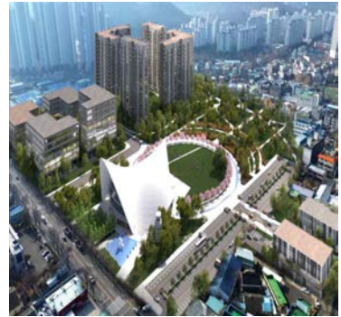
대구교도소 후석지 개발 -달성 아레나-