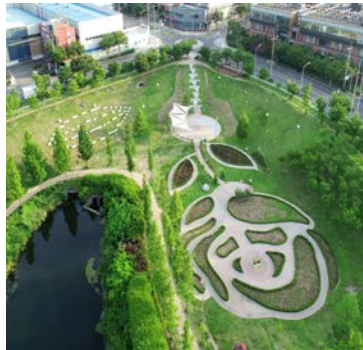
세천뉴테마정원 -대구 최초 지방정원-