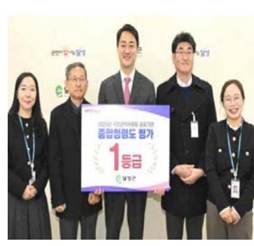
종합성령도 평가 1등급