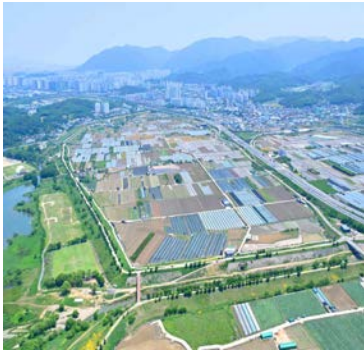
제2국가산단 예타 통과