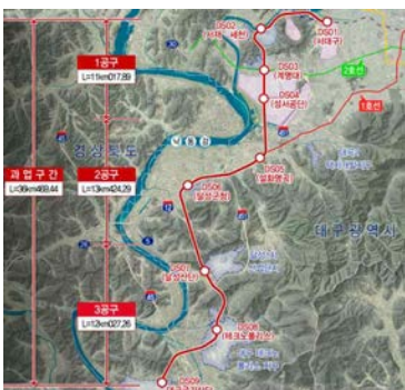
대구산업선 철도 착공