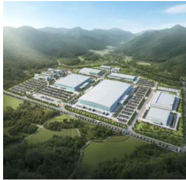
대구농수산물도매시장 이전 예타 통과