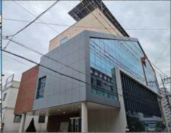
측면 및 뒷면