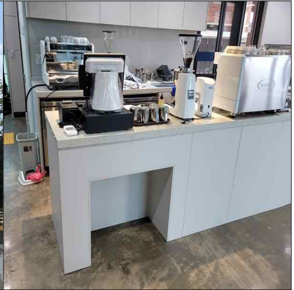
(2층) 실버 카페